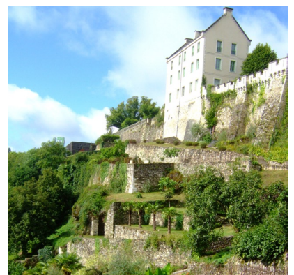
Photo 1 - Atelier gravure avec Charlotte Reine - Photo 2 - Jardins des Arts