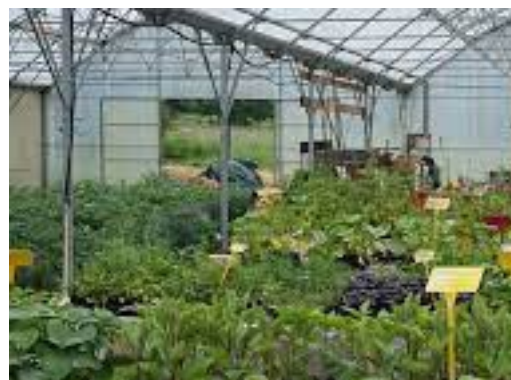
Photo 1 - teinture / Photo 2 - vue sous les serres