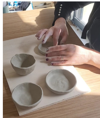
Photo 1 - chalets / Photo 2 - Pots pincés