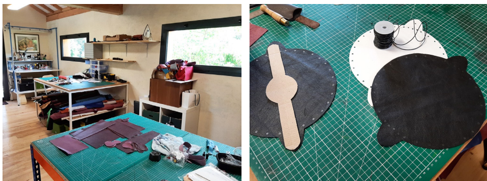
Photo 1 - vue de l'atelier de Natalie Appert © PEMA / Photo 2 - découpe des bourses © PEMA

Lieu : Rue Pégase, lieu dit Mazeroux Sud, Milhac-de-Nontron (24)