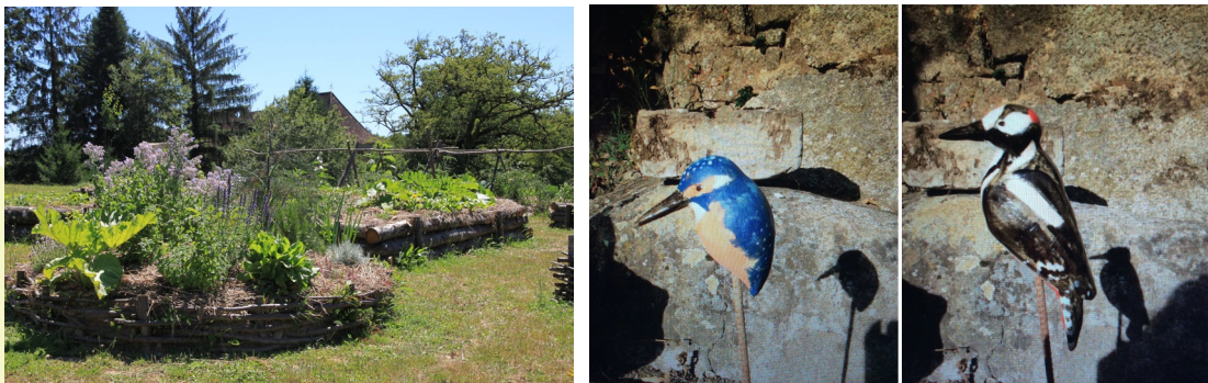
Photo 1 - vue des jardins de Frugie / Photo 2 - Créations Joff Williams

Lieu : Les jardins de Frugie, 24 450 Saint-Pierre-De-Frugie